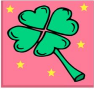
DAS VIERBLÄTTRIGE KLEEBLATT